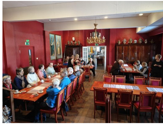
Munkkikahvit Punaisessa salissa

Paas poiketen -koulutuksessa tutustutaan toimintamalliin ja sen periaatteisiin, harjoitellaan kohtaamista ja suunnitellaan oman toiminnan käynnistämistä, koordinointia ja markkinointia.